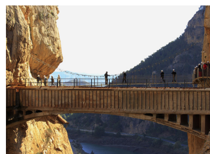
Terzo giorno : MALAGA - EL CAM. DEL REY - MALAGA (60 km)

Arrivo all'aeroporto di Malaga. Incontro con il rappresentante ILC per il trasferimento privato in hotel. Sistemazione prevista in uno degli alberghi più esclusivi di Malaga: il "Grand Hotel Miramar" categoria 5 stelle. La sua posizione nel centro di Malaga, nella zona de La Caleta, tra il Paseo de Reding e il mare, renderanno il vostro soggiorno una esperienza indimenticabile. Sistemazione camera doppia Premium.