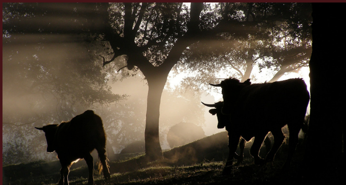
Quarto giorno : MALAGA - RONDA - MALAGA (100km)