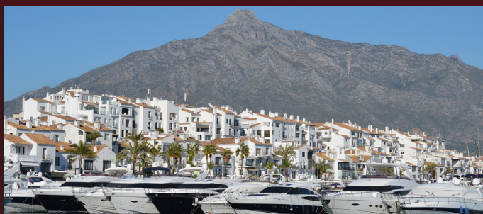
Sesto giorno : MALAGA - MARBELLA - MALAGA