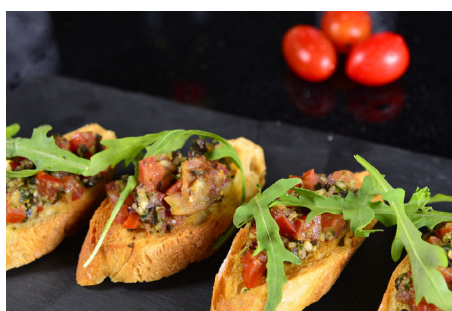
Secondo giorno : MALAGA