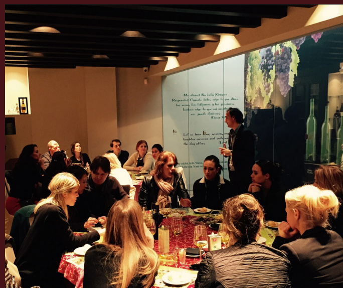
Settimo giorno : MALAGA

Trasferimento in aeroporto per il volo di rientro in Italia