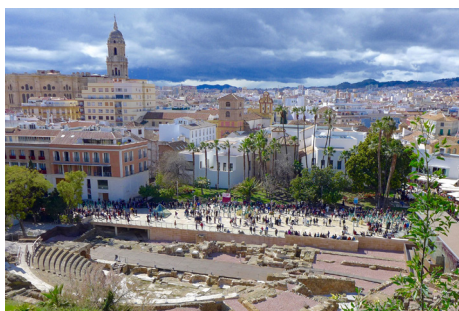
Primo giorno : MALAGA