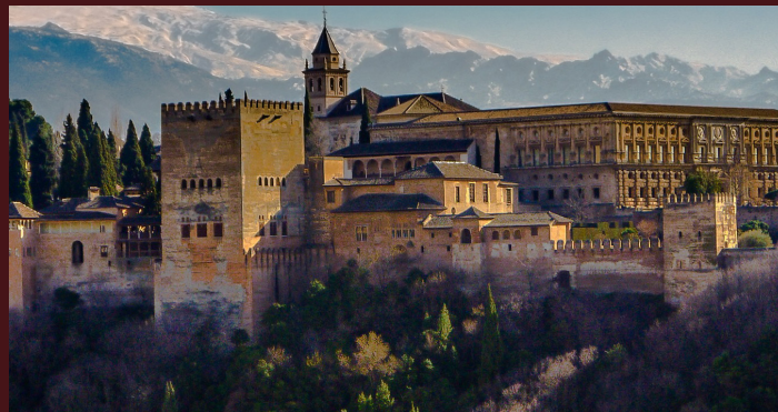
Quinto giorno : MALAGA - GRANADA - MALAGA (130 km)